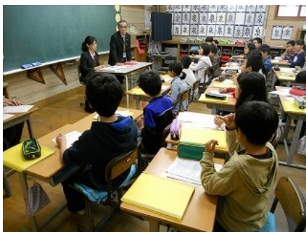
修学旅行授業—旅行者との学習会

昨年度の6年生から、修学旅行を字の如く『学びの旅行』にしようと新しい取組を実施しています。今年の6年生もそれを受け継ぎ、総合的な学習の時間で「修学旅行をつくる」と位置づけ、班別のグループ行動では、どこにどのような方法で行くか、インターネットやガイドブックやパンフレット等をもとに、移動手段やその値段も調べるなど、主体的な活動を展開しています。